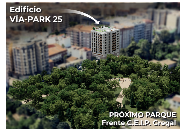
Edificio VÍA-PARK 25